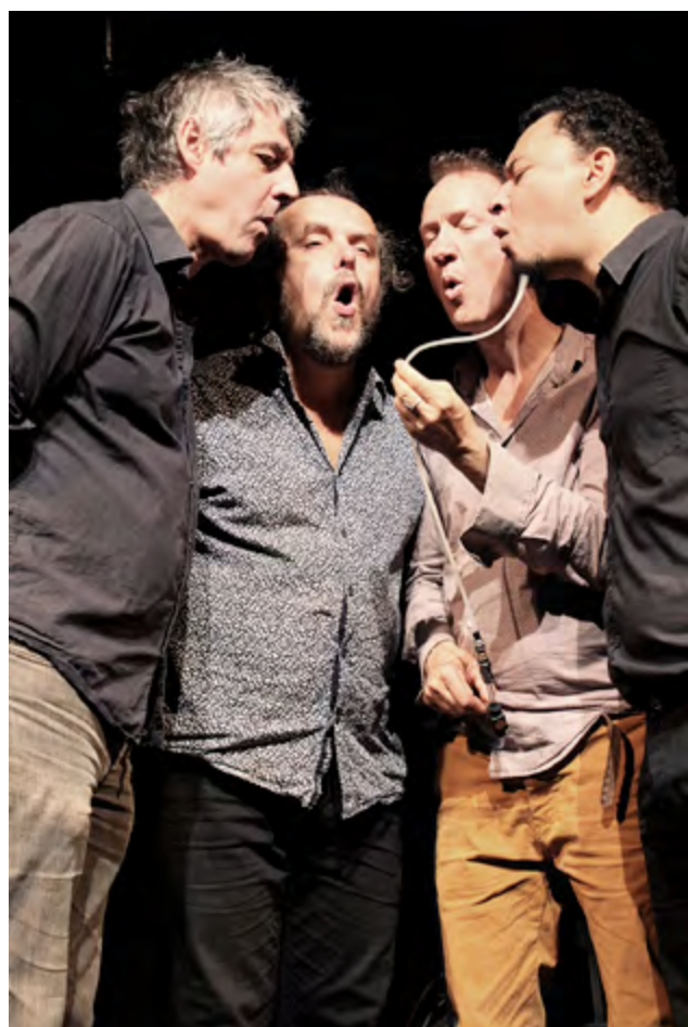
Résidence artistique WABLA au Grand Mix (Tourcoing) - 2017