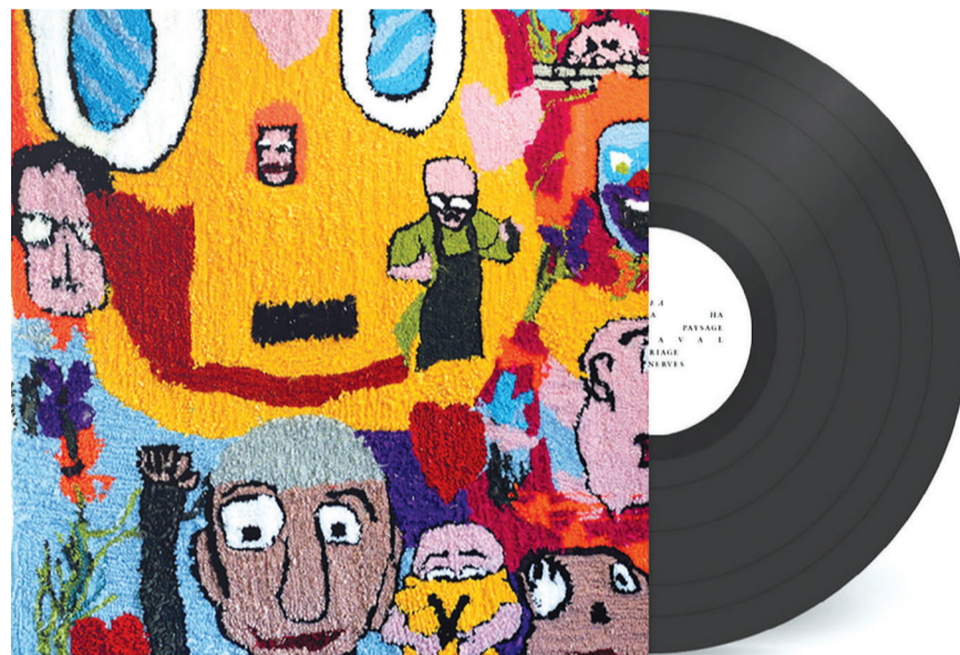
Les Borigènes , nouvel album des Humming Dogs, chez Bison Records.

Plus d'infos sur oiseau-mouche.org ou contact@oiseau-mouche.org / 03 20 65 96 50.