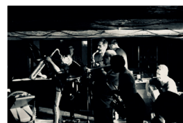
Confiture du 14/10/2018

Avec des membres du collectif Muzzix et des musiciens invités