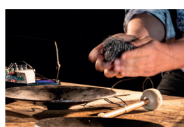
Murmur metal solo

En collaboration avec la maison Folie Wazemmes - Ville de Lille