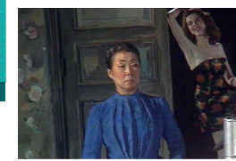
La Femme à la cafetière de R.Wilson

En collaboration avec Heure Exquise ! et le Cinéma l'Univers