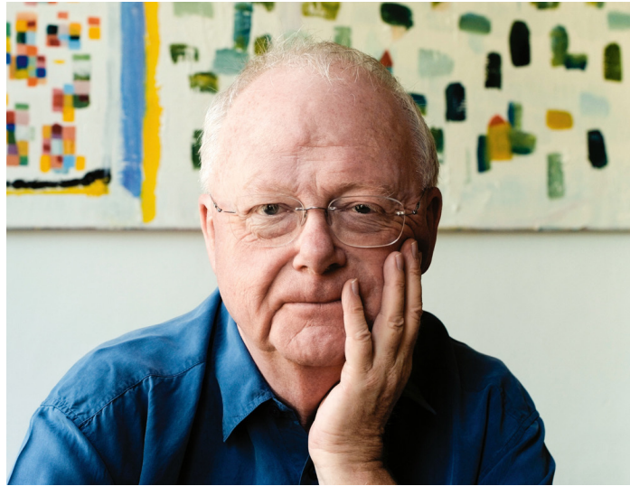
Louis Andriessen